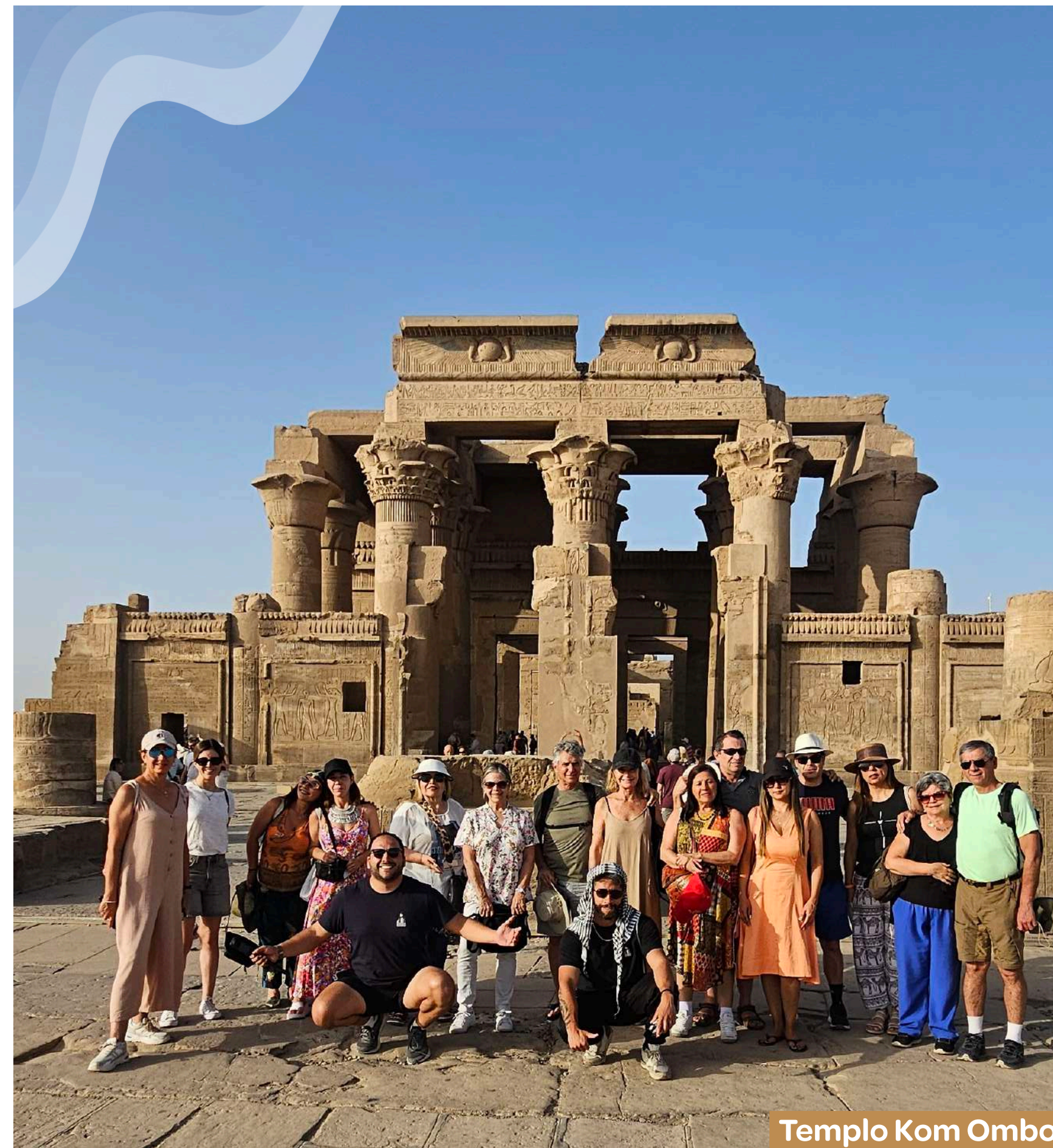
Templo Kom Ombo

¡ Atacama Extrema es la agencia que estabas buscando! Somos especialistas en realizar viajes grupales a prácticamente todos los rincones del mundo . Hemos visitado todos los lugares que tú deseas conocer para ofrecerte la mejor de las experiencias., desde los antiguos templos hasta los vibrantes mercados locales. Descubre el mundo con Atacama Extrema, crea recuerdos y experiencias que durarán para toda la vida.