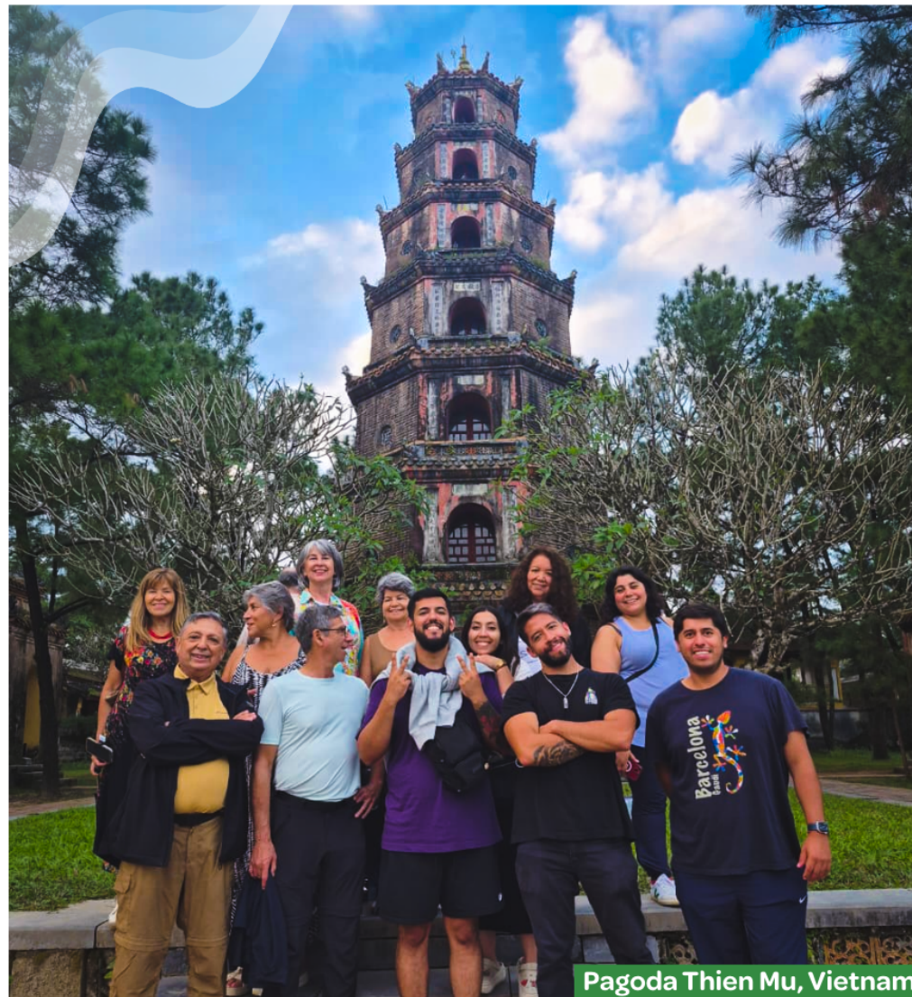
Pagoda Thien Mu, Vietnam

¡ Atacama Extrema es la agencia que estabas buscando! Somos especialistas en realizar viajes grupales a prácticamente todos los rincones del mundo . Hemos visitado todos los lugares que tú deseas conocer para ofrecerte la mejor de las experiencias, desde los antiguos templos de Egipto hasta los vibrantes mercados de Vietnam. Descubre el mundo con Atacama Extrema, crea recuerdos y experiencias que durarán para toda la vida.